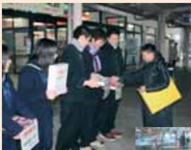
◀七尾駅前での募金活動 3/16(水)