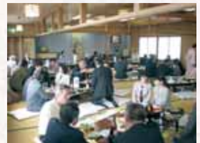
楽しい時間をくみかわしました