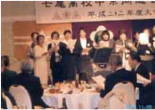
女性達による合唱