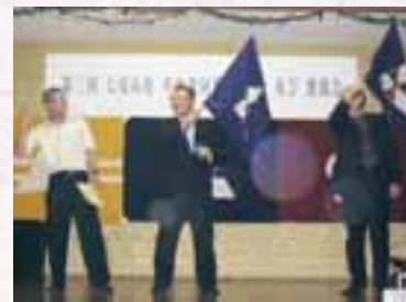
山田石川県議会議員 (高18期) の力強い旗さばきです