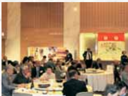
七尾らしさあふれる会場