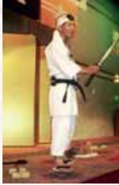
大道芸人(角氏-高19期) による技の披露