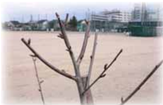
4/3 (日) の河津桜 ～平成22年12月12日 高6回生植樹～

詳細は地元幹事で決定し、各自へ案内 を出す予定です。4年振りの開催にな ります。案内がありましたら、是非共 参加よろしくお願いします。