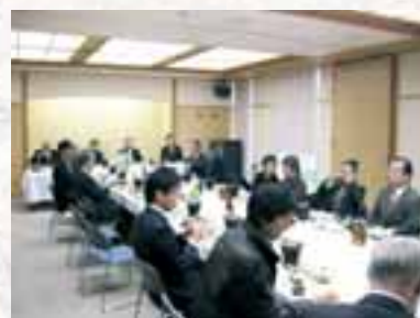
皆様顔を合わせたの懇親会