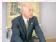
谷内議長により議事進行です