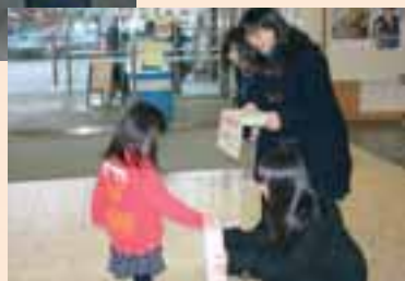
パトリア店内での募金活動 3/18(金) ▶