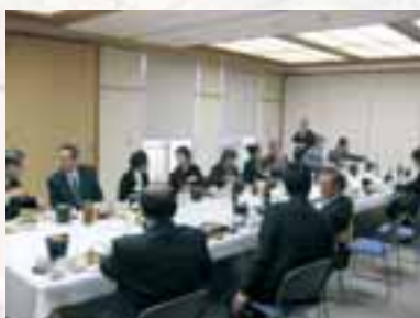
和気藹々と話がすすみます