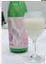
地元のしろなま酒で開会