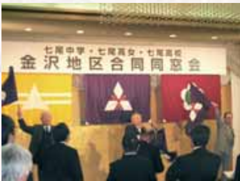
旗さばきはお手のもの