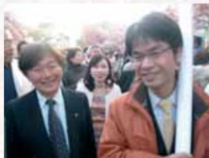
会場近くの八重桜トンネルです (大阪造幣局周辺)