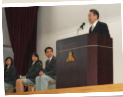
NSU ハイスクールとの交流 ▼