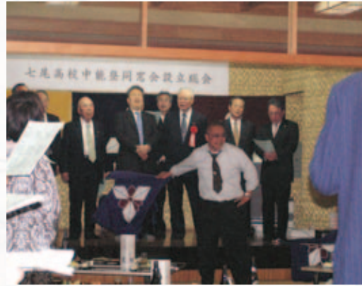
平常歌ア〜、アインス、ツヴァイ、ドライ