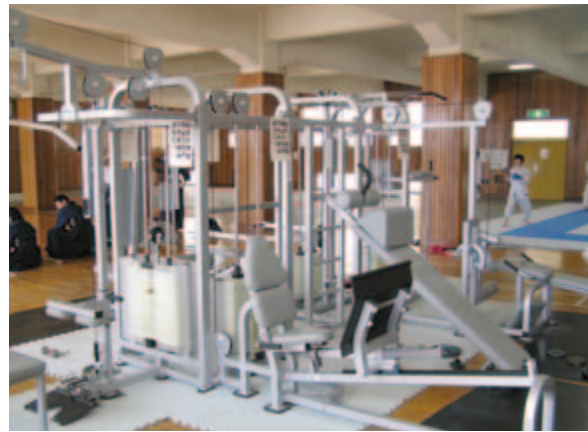
筋力トレーニング用 マシン一式 (第2体育館に設置)