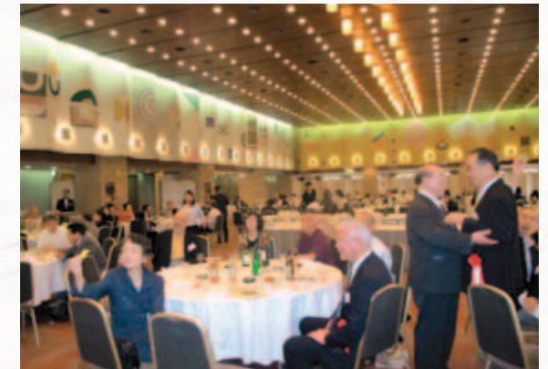
懇親会場の雰囲気