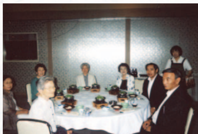
支部役員会の様子