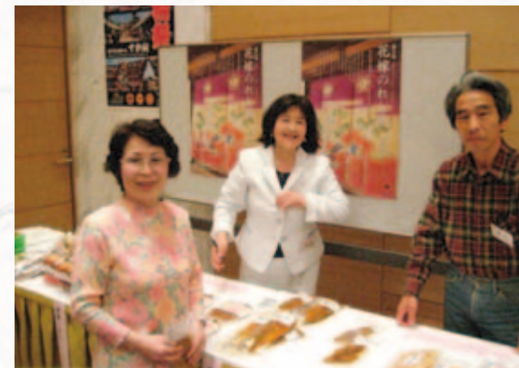
能登のまいもん市場と花嫁のれん展