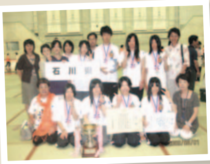
全国総文 小倉百人一首かるた大会 準優勝