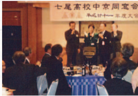
大林本部長と高13の仲間達