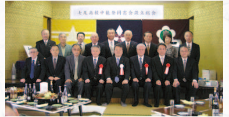
杉本中能登町長も交わり記念撮影