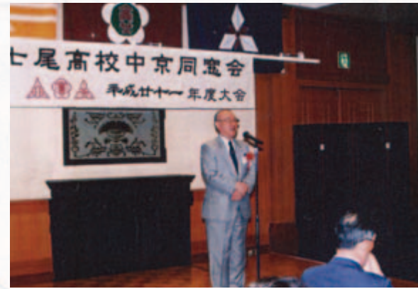
小山石川県人会会長（高5）のご挨拶