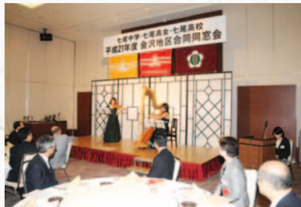
ハープとヴァイオリンの演奏によるオープニングで同窓会は幕を開けました。