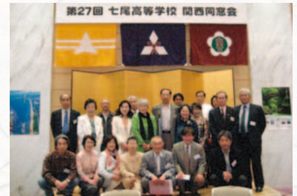
幹事一同 準備完了