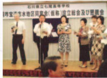
八十田校長も声高らかに