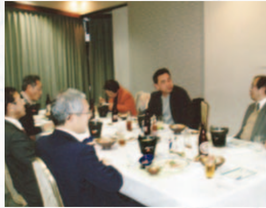
支部役員会兼懇親会の様子