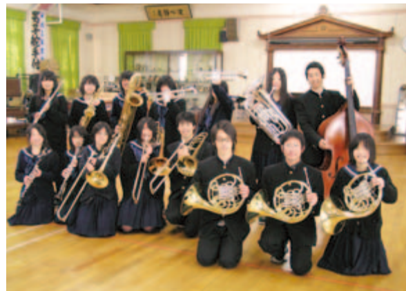
吹奏楽局に対して、 楽器（及びスピーカー等） (講堂)