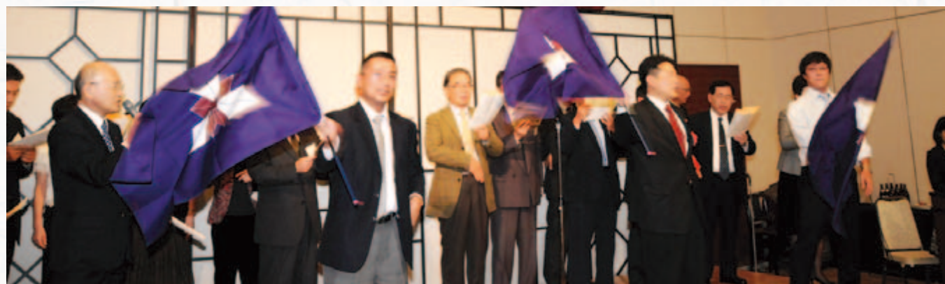
校旗を持つ手にも力が入ります。