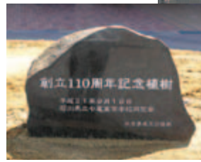
記念植樹（ケヤキ）と 記念石碑 (校舎前庭)