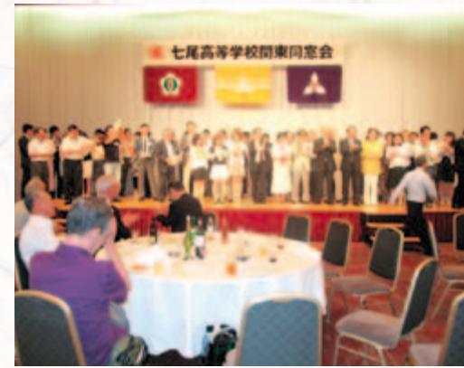
壇上での校歌斉唱