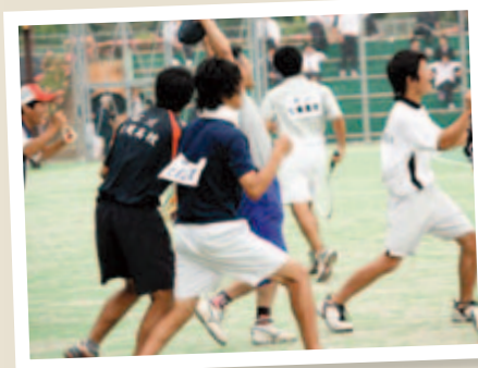
▲ 男子団体 ソフトテニス部 インターハイ出場(11年ぶり)