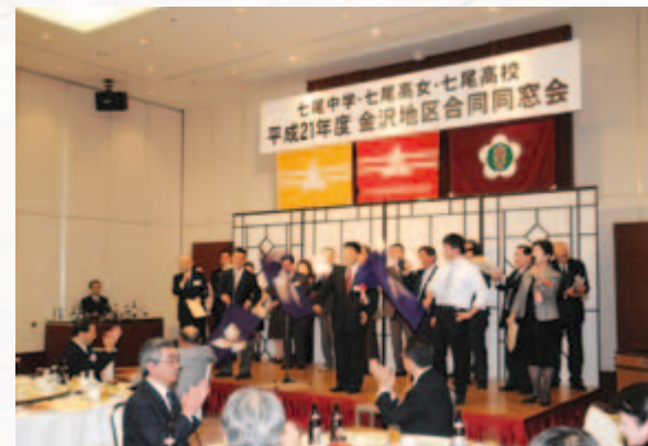
例年にも増してステージは盛り上がりました。