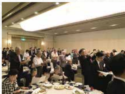
平常歌・校歌の斉唱