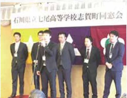
若い方も多く参加されました