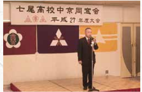
松本新会長のご挨拶です