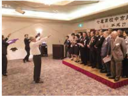
全員で平常歌を歌いました