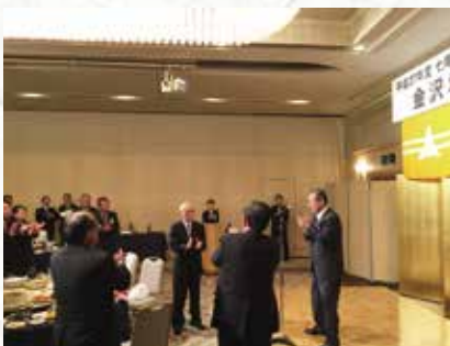
来年の再会を約束し、一本締め