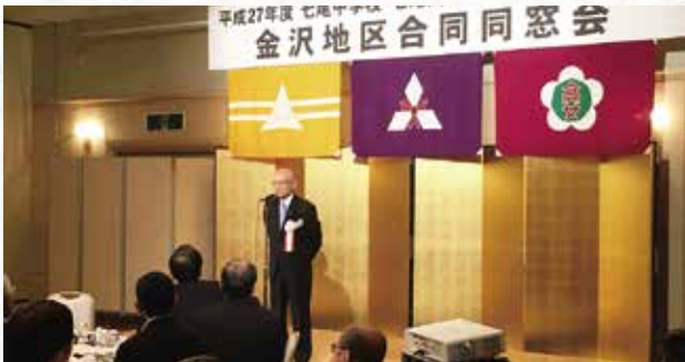
高澤会長よりご挨拶です