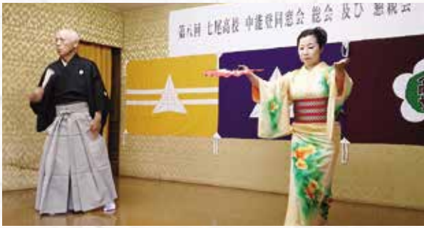
七尾まだらの演舞です