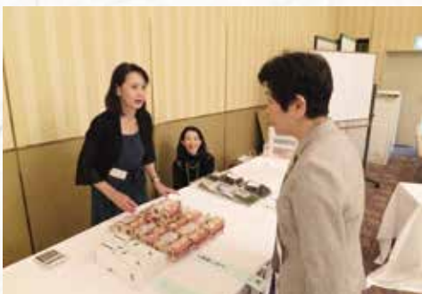
物産即売会「能登は、いらんかいね！」