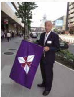
関西同窓会へようこそ！