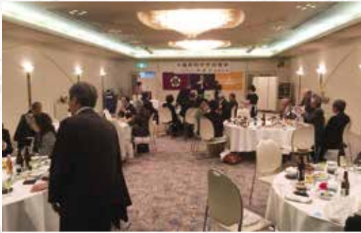
各テーブルで楽しくお話されています