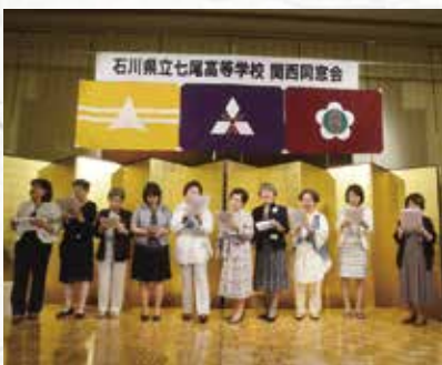
校歌・平常歌・ふるさと大合唱