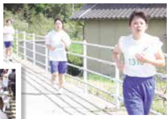
校内陸上競技大会 (マラソン)