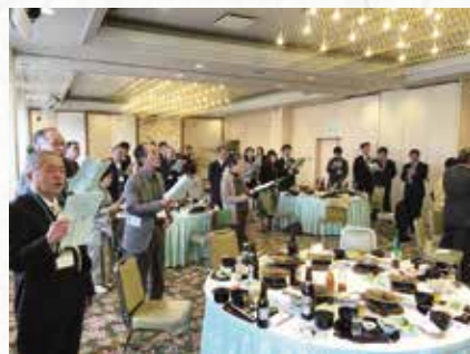
校歌・平常歌を合唱