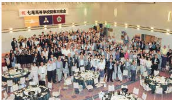
50周年記念大会にご参加の皆様です