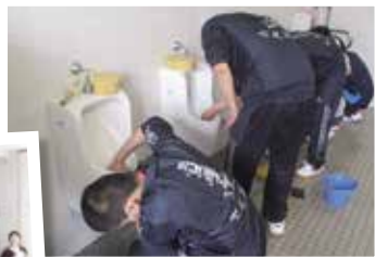
トイレ清掃ボランティア