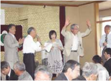
抽選会も行われました